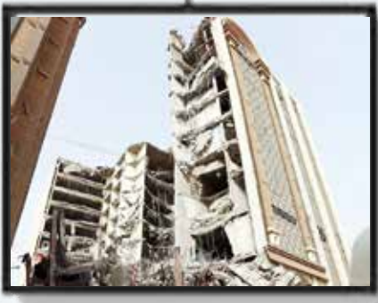
سرقت صندوق امانات بانک ملی