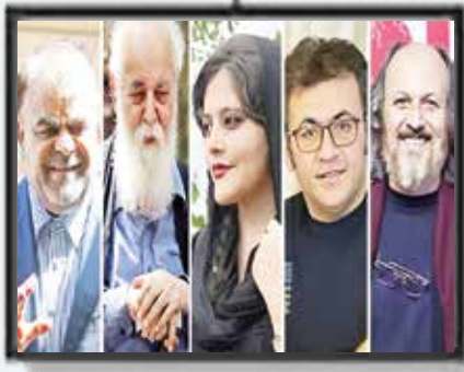
آتش سوزی در اوین