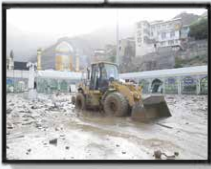
خروج قطار مشهد-یزد