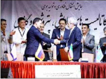
رئیس‌مجلس شورای اسلامی در مراسم افتتاح کاتالیست‌های بومی‌سازیکوچین