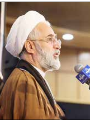
دادستان کل کشور؛

کارشناس مسائل امنیتی و دفاعی در گفت و گو با امتیاز: تهدیدات امنیتی از طریق قدرت موشکی و توان نظامی خنثی می‌شود