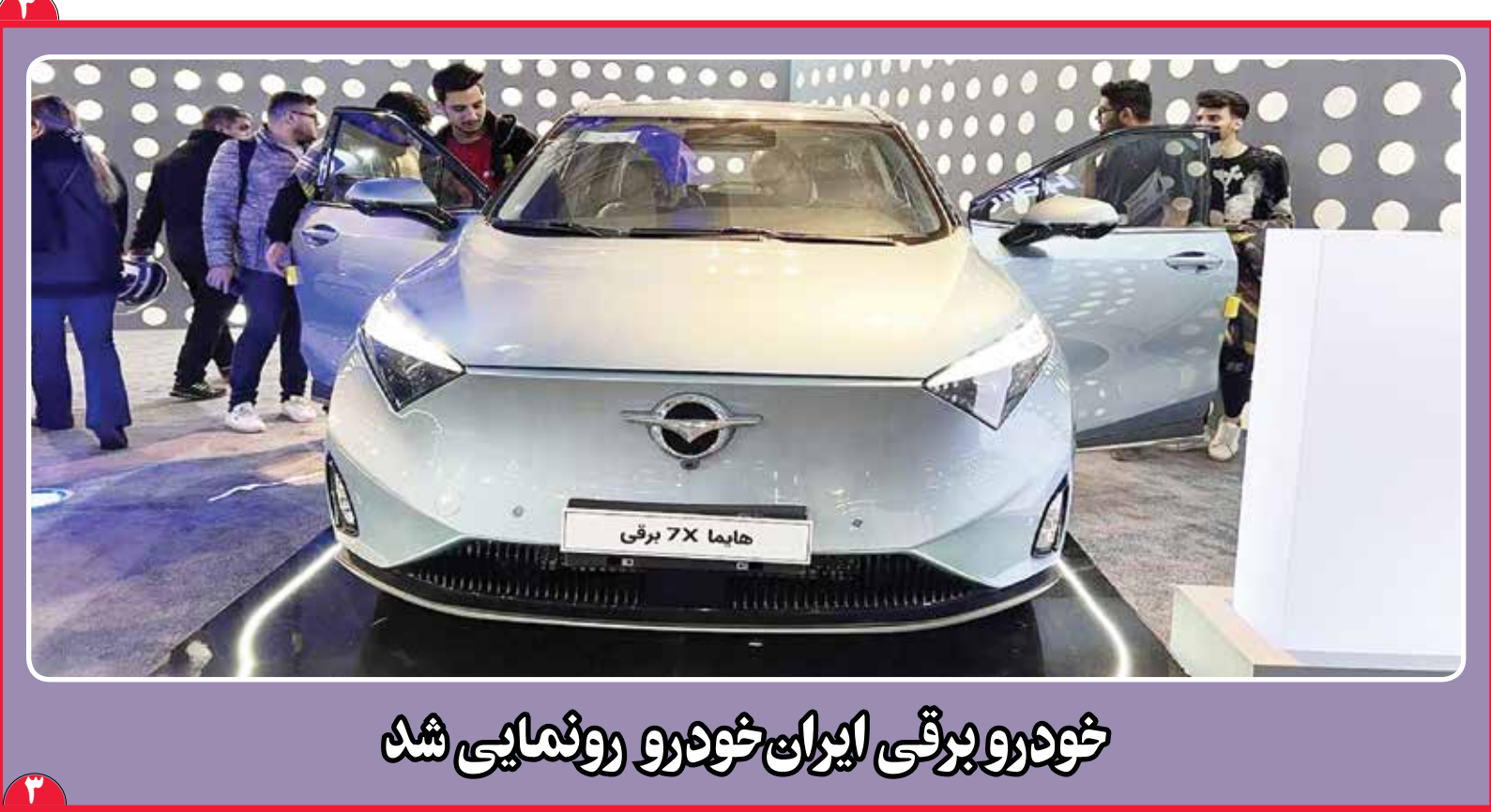
خودرو برقی ایران خودرو رونمایی شد

دادستان کل کشور در دیدار رئیس سازمان محیط زیست: فعالیت های اقتصادی که با آلودگی محیط زیست ملازمه پیدا کند ممنوع است